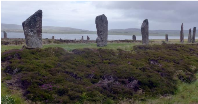
Der Steinkreis von Brodgar

Wilhelm-Ostwald-Institut für Physikalische und Theoretische Chemie Linnéstraße 2, 04103 Leipzig