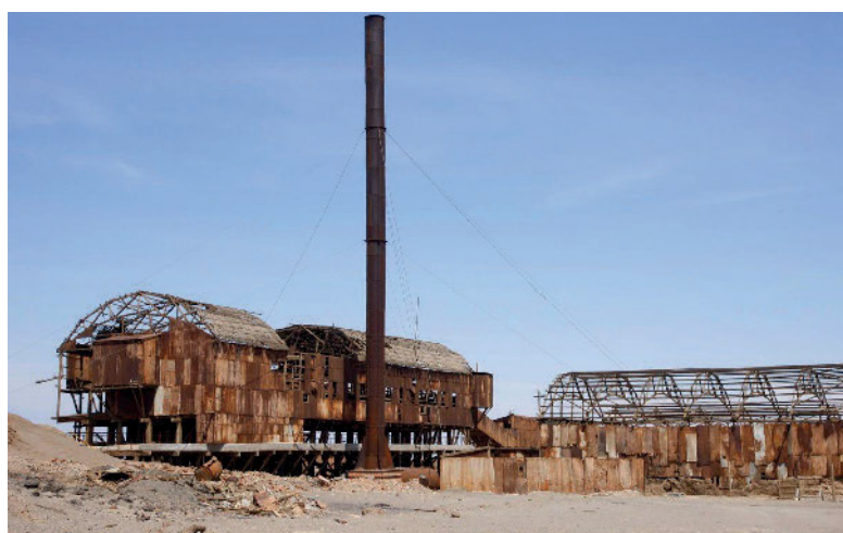
Gebäude der ehemaligen Salpeterwerke Humberstone und Santa Laura in der chilenischen Atacama-Wüste. Auch sie sind heute Unesco-Weltkulturerbe.