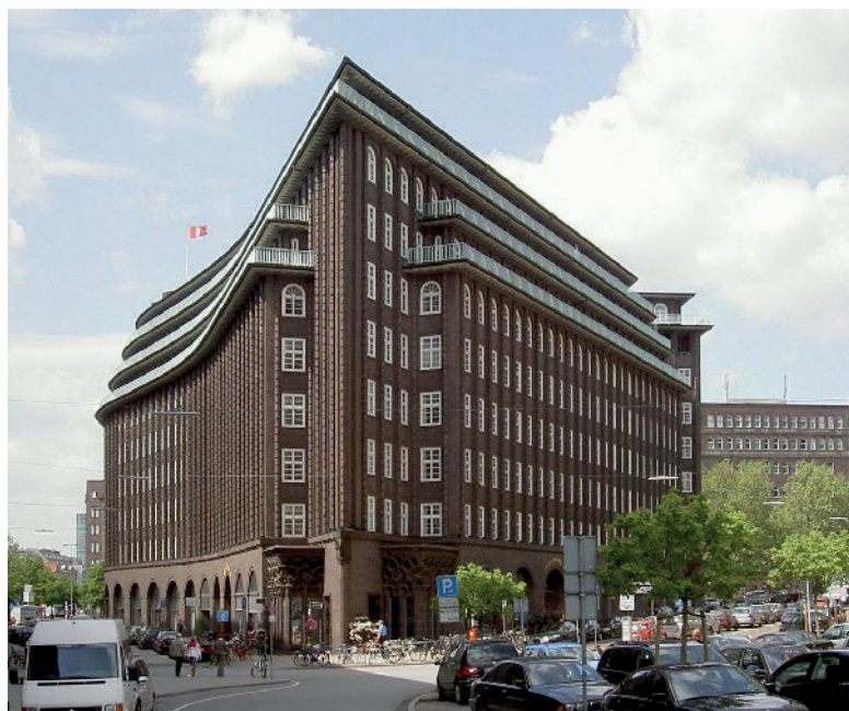
Das in den Jahren 1922 bis 1924 von Fritz Höger erbaute Chile-Haus in Hamburg: elf Stockwerke hoch, 2800 Fenster, eine Fläche von etwa 30 400 m 2 . Seit 1983 steht das Chilehaus unter Denkmalschutz; seit dem Jahr 2015 steht die „Hamburger Speicherstadt und das Kontorhausviertel mit Chilehaus“ in der Liste des Unesco-Welterbes.